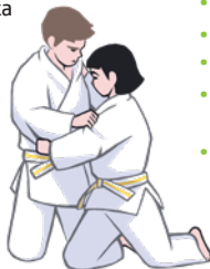
přechod do kesa-gatame

hajime - začátek mate - konec tatami - žíněnka seiza - klek při nástupu