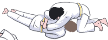
přechod do mune-gatame