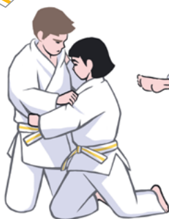
přechod do kesa-gatame z kleku